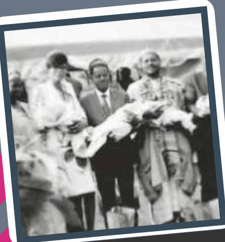
Arbre de Noël