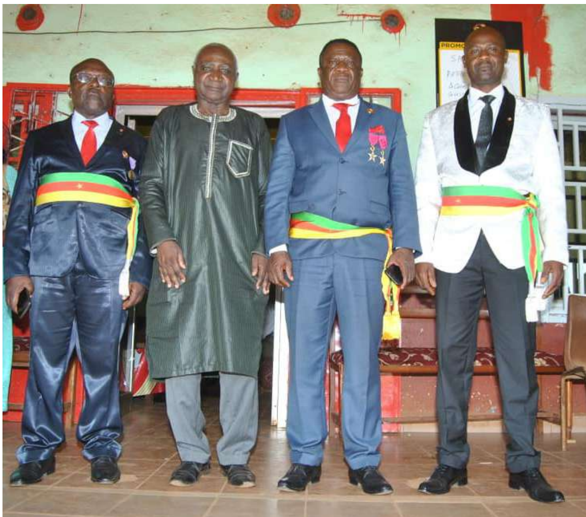
PHOTO DE FAMILLE AVEC LE MAIRE SORTANT