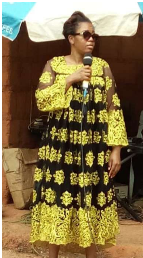
Le témoignage de Mme Le Sous Préfet