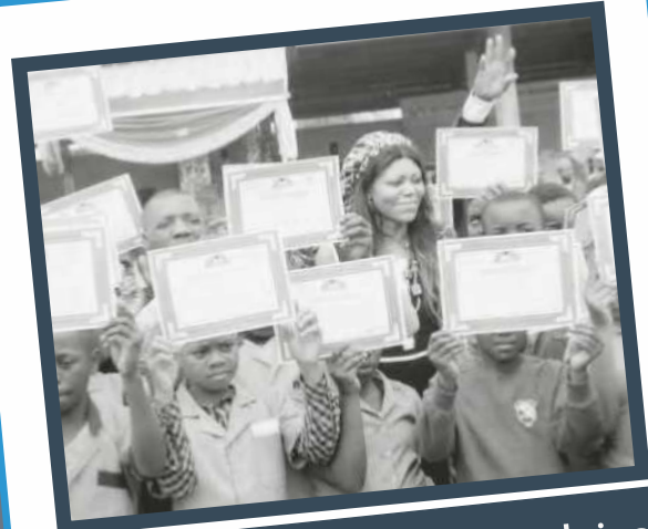
Prix de l'excellence scolaire