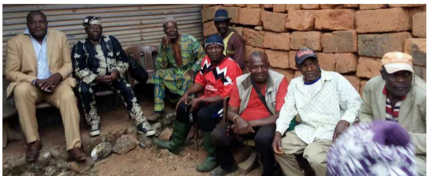
Les notables et amis du village Famgoum 2