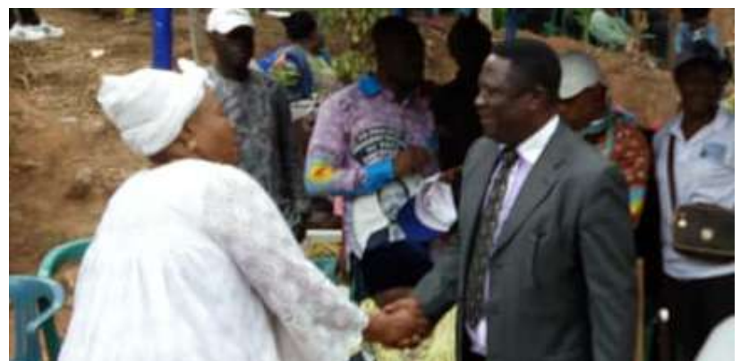
Le reconfort de Monsieur le Maire à la veuve