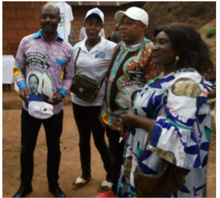
La présence reconfortante du RDPC, Parti politique ami