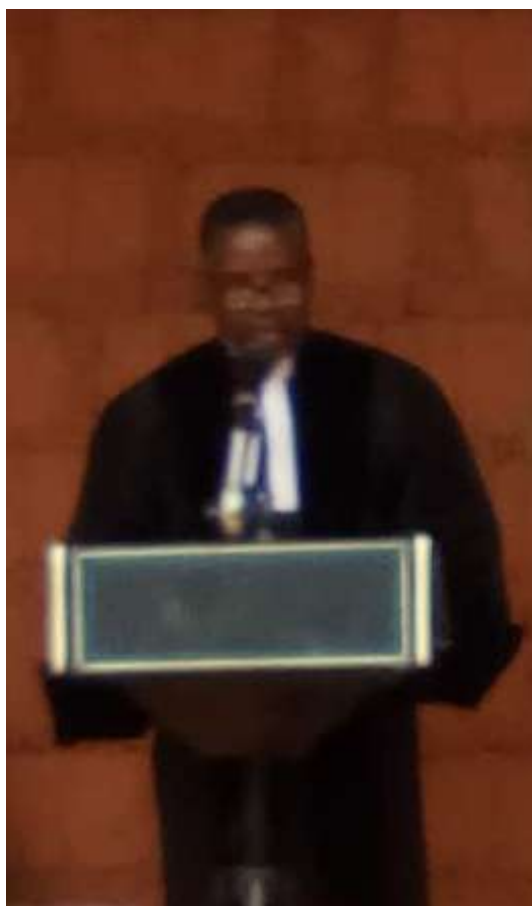
Le révérend pasteur Officiant du jour