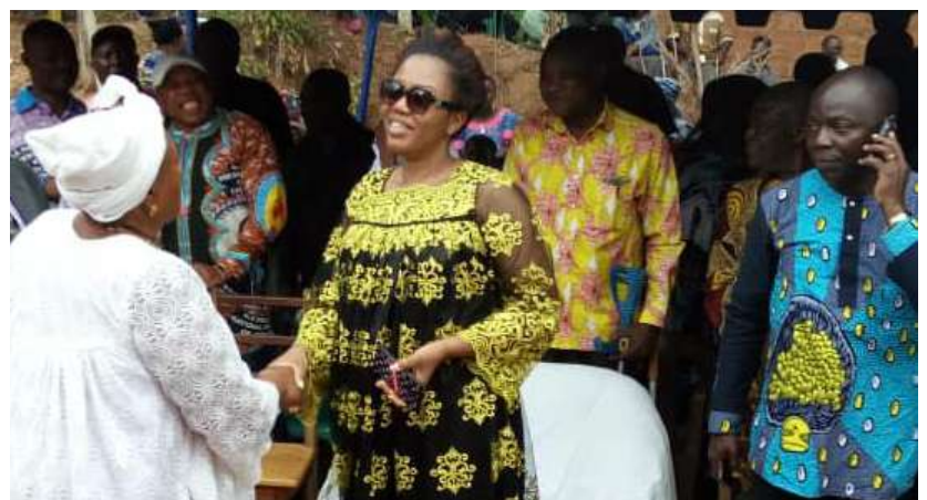
Le reconfort de Mme le Sous Préfet à la veuve

UN REPORTAGE PHOTOGRAPHIQUE DE TAKOUGANG MOLAPI PASCAL