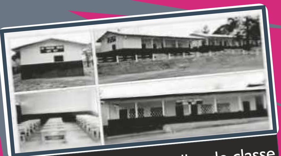
Construction des salles de classe